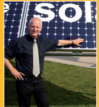
Bernd Frank Regenerative Energiesysteme